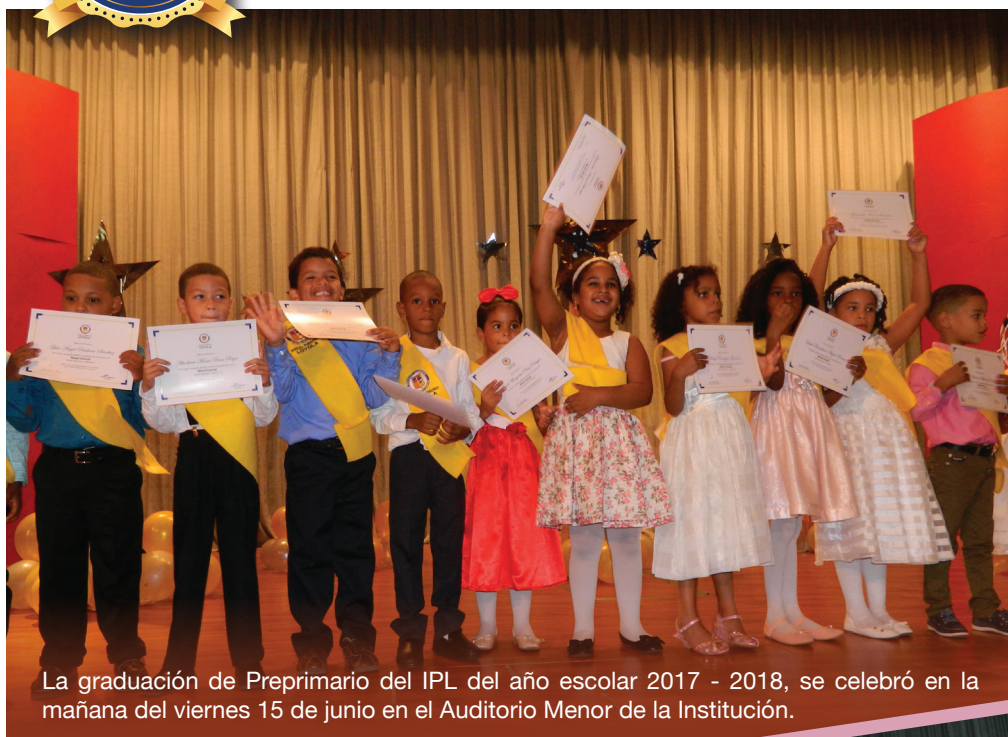
La graduación de Preprimario del IPL del año escolar 2017 - 2018, se celebró en la mañana del viernes 15 de junio en el Auditorio Menor de la Institución.