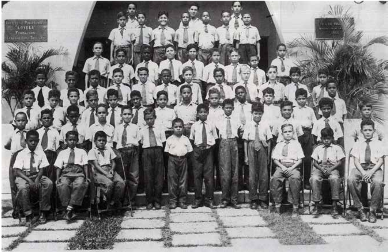
Los sesenta y tres primeros alumnos que ingresaron al Instituto Politécnico Loyola el 25 de octubre de 1952.