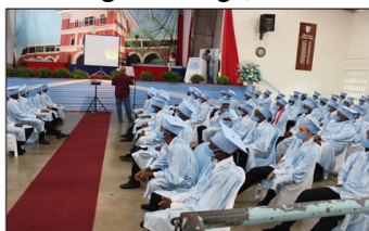
St. George's College Graduation