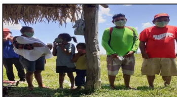
The faithful eager for Mass

"When is the church opening?" a frequent question asked these days. Region 9 and 8 are hot spots of covid 19. Churches remain close due to the increasing number of covid 19 cases. Villages leaders and