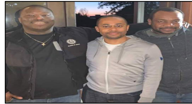
Our brothers in Berkeley