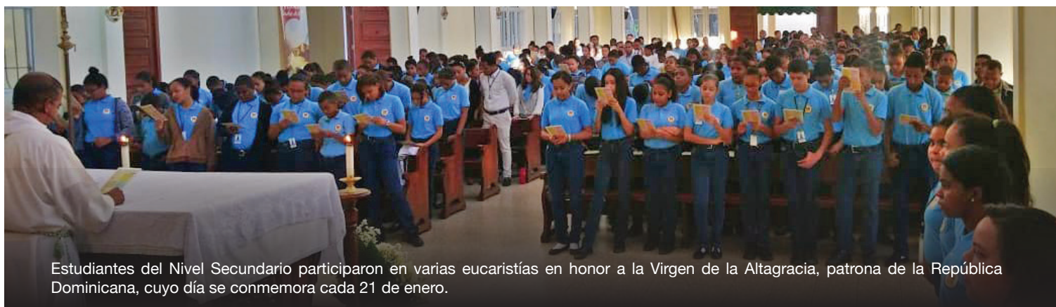
Estudiantes del Nivel Secundario participaron en varias eucaristías en honor a la Virgen de la Altagracia, patrona de la República Dominicana, cuyo día se conmemora cada 21 de enero.