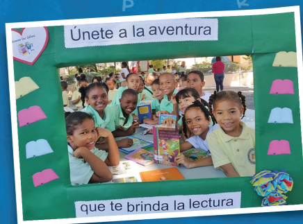
Foto de archivo: Actividad "Fomentando el amor por la lectura en los niños".