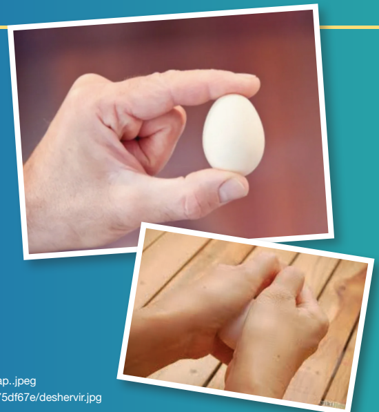
Imagen: http://4.bp.blogspot.com/-hX113bltClw/Uu9tPBz_8I/AAAAAAAAAEs/C77CfLgLyPU/s280/exp.huevo+ap..jpeg https://estaticos.muyinteresante.es/media/cache/760x570_thumb/uploads/images/article/5536592a70a1ae8d775df67e/deshervir.jpg

Pídele a tu mamá un huevo —tiene que estar crudo, no se vale un huevo cocido— y trata de presionarlo fuertemente con ambas palmas de tus manos por los extremos, verás que si lo mantienes en la misma posición y tu presión se ejerce correctamente desde ambos lados, será muy difícil que se rompa. Es una demostración de las leyes de la física, investiga o pregunta la explicación a tu profesor y comparte con tus amigos esta experiencia interesante y divertida.