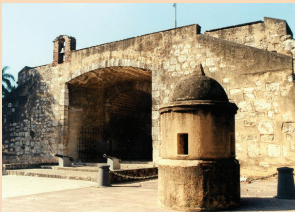
La Puerta del Conde servía de entrada a la antigua ciudad de Santo Domingo.