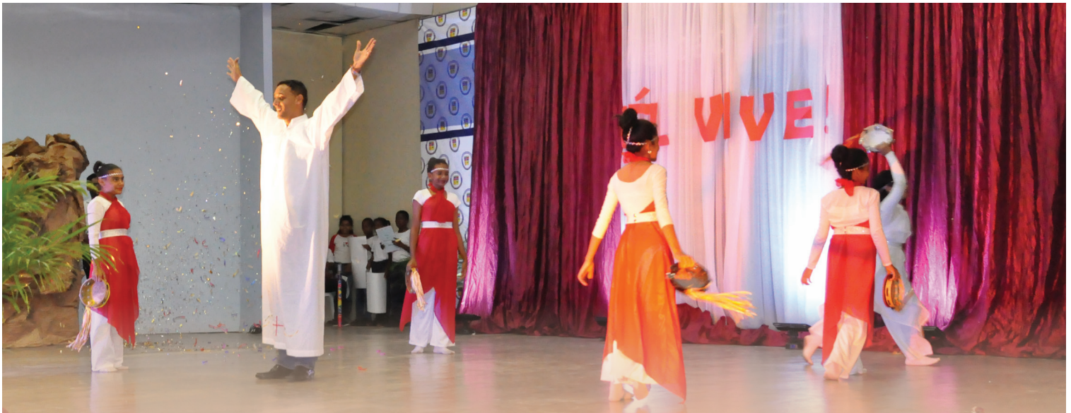
Pascua de Resurrección. El 4 de mayo, los niveles Primario y Secundario del IPL celebraron en el Auditorio Mayor la Pascua de Resurrección bajo el título “ÉL VIVE”, con el lema “Ven y contagia con tu alegría”. Los estudiantes expresaron con manifestaciones artísticas la alegría por la victoria de Jesús ante la muerte.